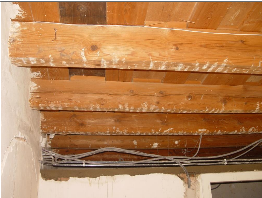
Nález trámového dreveného stropu s prekladaným záklopom pod mladším podhľadom v miestnosti s renesančnou arkádou počas obnovy objektu v r. 2021.