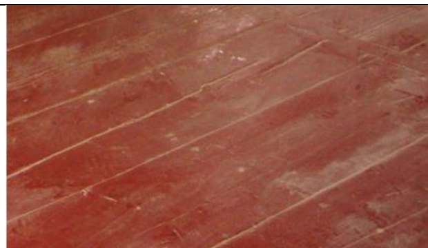
Detail pôvodných doskových podláh s červeným olejovým náterom.