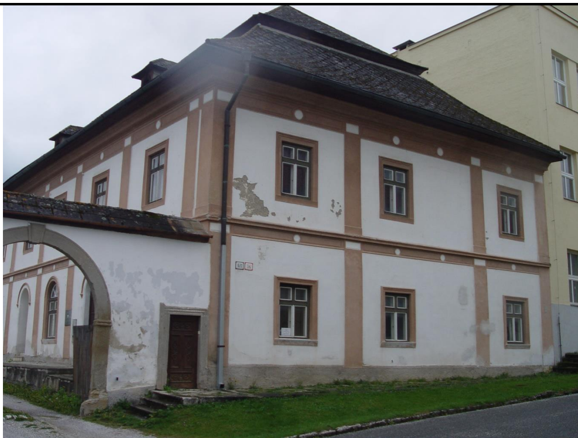
Pohľad čelný na objekt Kanónie č. 14 z Kapitulskej uličky s manzardovou strechou a strešnými vikiermi orientovanými do dvora