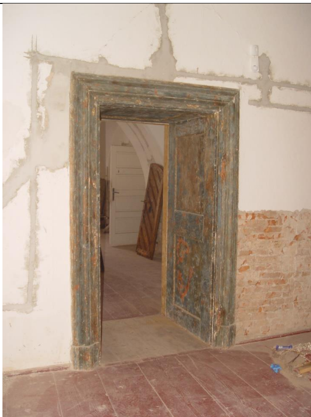
Doskové podlahy v západnom trakte prízemia s obnovovanými maľovanými barokovými dverami z dotácie poskytnutej v r. 2021.