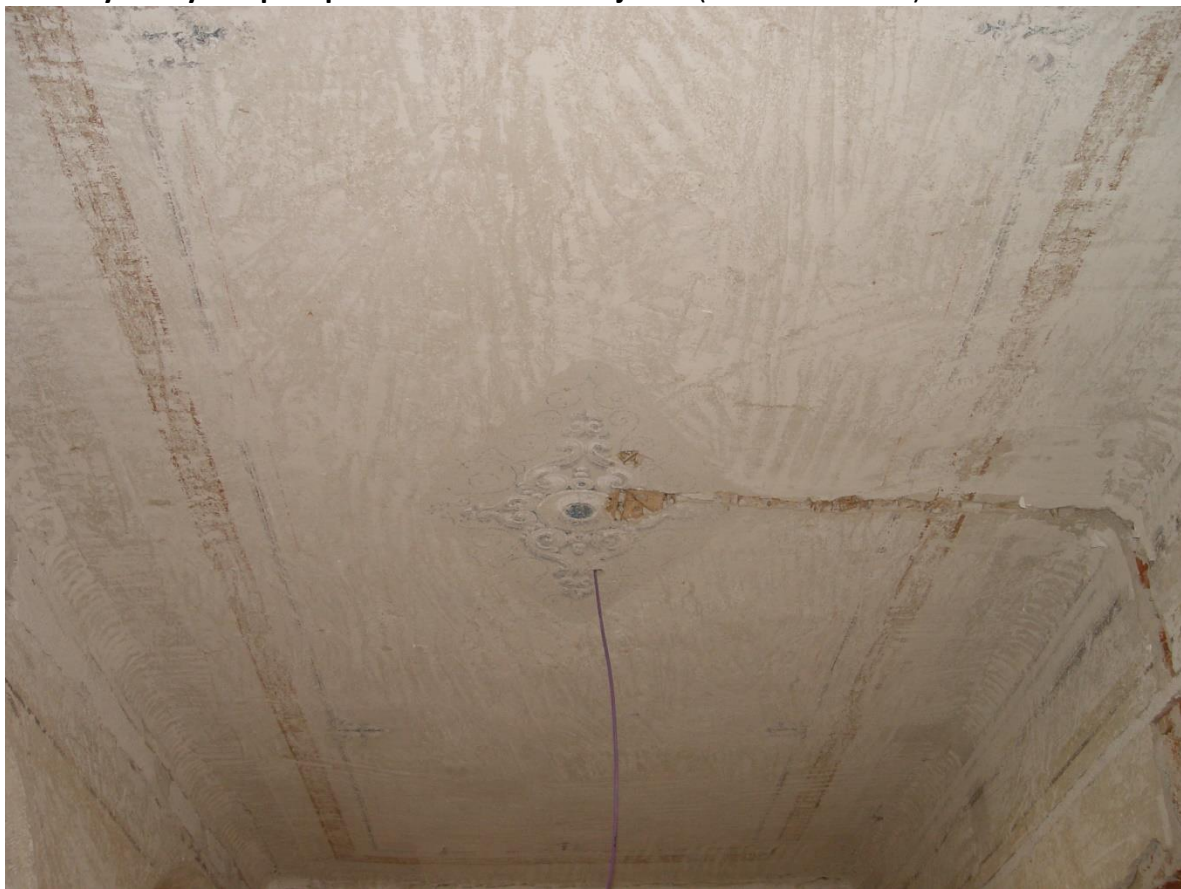
Detail výmalby na podeste schodiska.