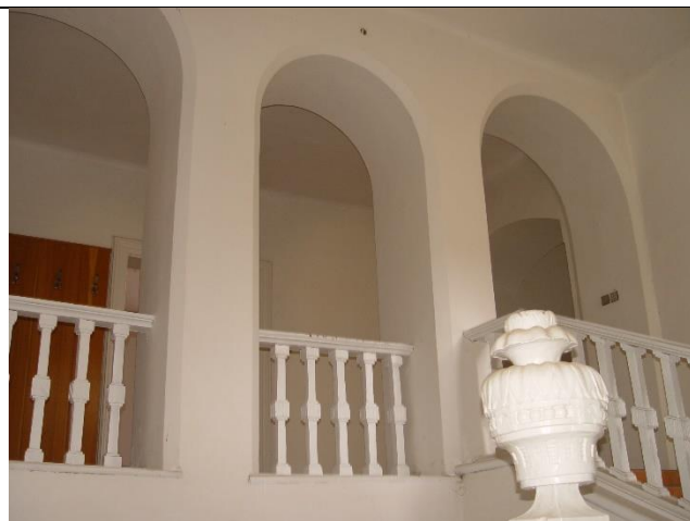
Balustrové zábradlie medzi piliermi murovanej arkády schodiska na poschodí