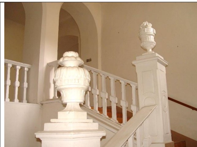
Balustrové drevené zábradlie schodiska medzi prízemím a 2. NP určené na umelecko-remeselnú obnovu.