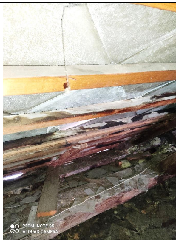
Poškodenie krovu a laťovania vplyvom zatekajúcej, napriek častým opravám, vekom zdegradovanej – krehkej AZC krytiny.