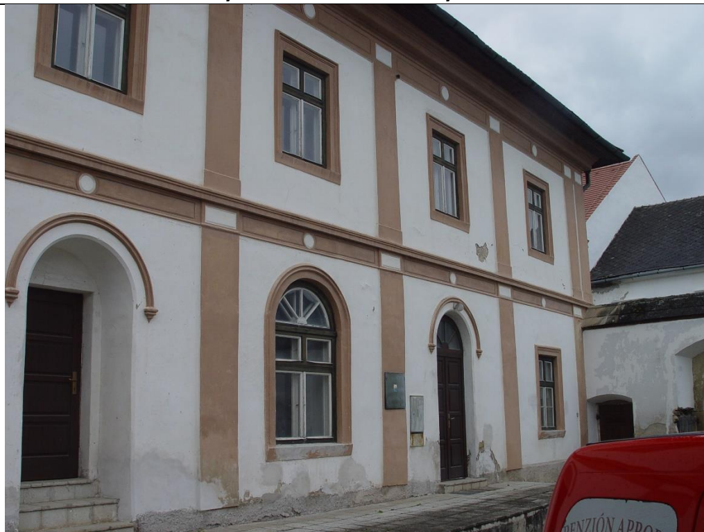
Pohľad so vstupmi do objektu z dvora kanónie, bočná fasáda.