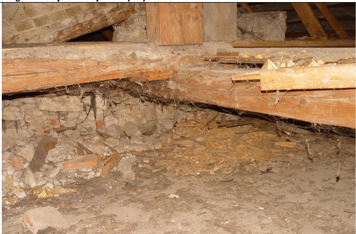
Krov je poškodený aj drevokazným hmyzom a na mnohých miestach aj hnilobou. V minulosti bol už viackrát opravovaný a jednotlivé súčasti vymieňané.