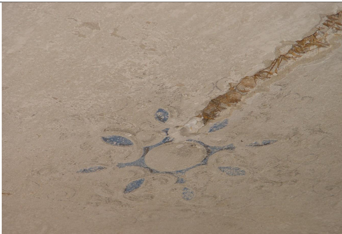
Detail ornamentu v zrkadle schodiska