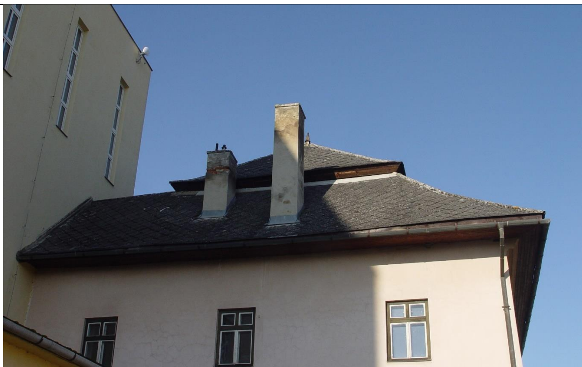
Manzardová strecha s poškodenou krytinou z azbestocementových šablón a dvojica rozpadávajúcich sa pôvodných komínových telies (v nadstrešnej časti už sekundárne premurovaných).