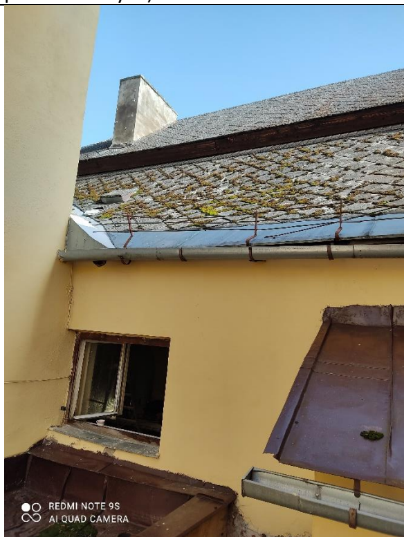
Krytina z AZC šablón zo strany od vysokého seminára je značne poškodená a prerastená machmi.