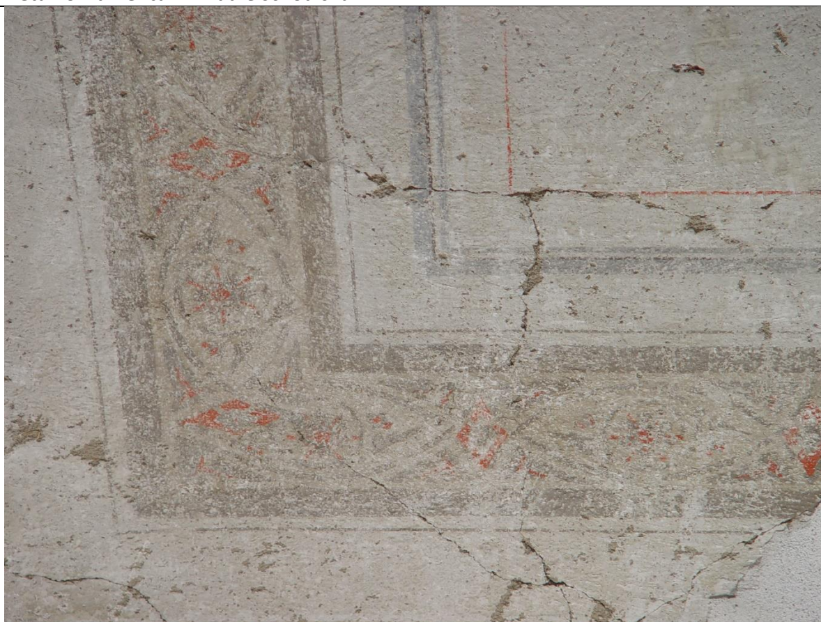
Detail výmalby po reštaurátorskem začistení v sonde na strope nad schodiskom.